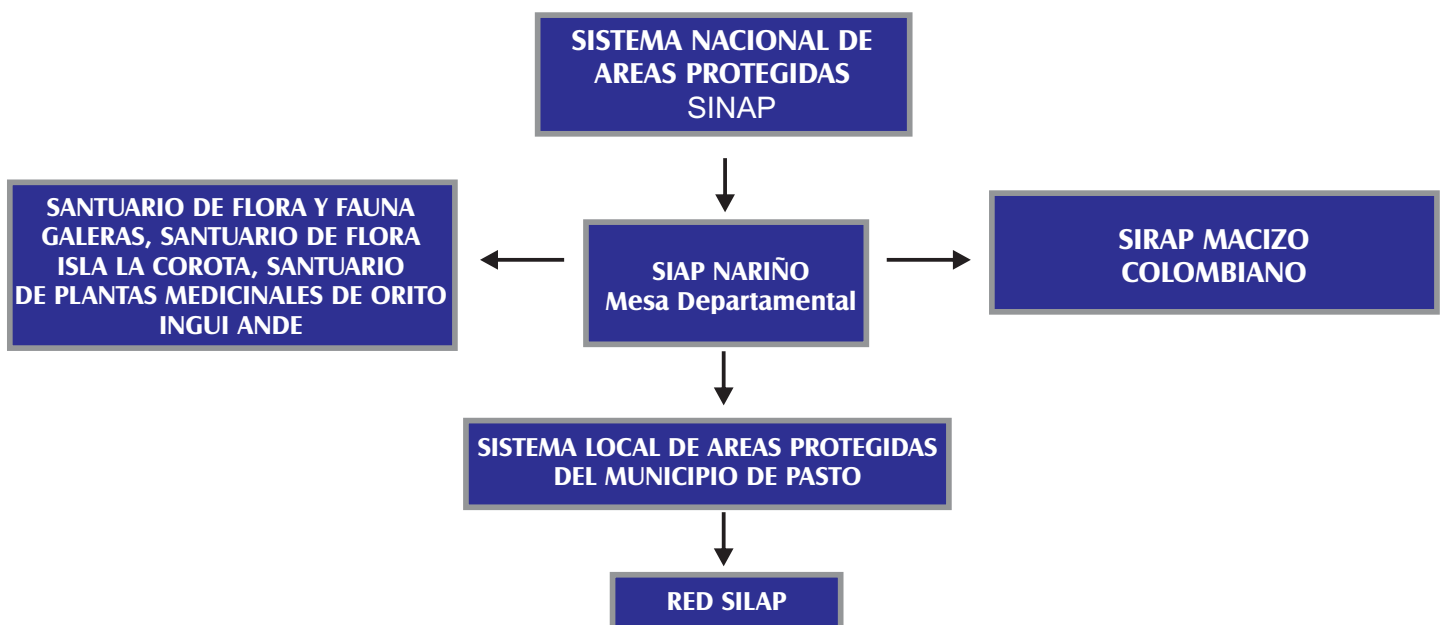
Figura No. 2 ESQUEMA ORGANIZACIONAL DE LA RED-SILAP

El SILAP PASTO se crea mediante acuerdo 041 de 29 de noviembre de 2010 emanado por el Concejo Municipal de Pasto, definiéndolo como: el conjunto de todas las Áreas Naturales Protegidas declaradas y no declaradas, además áreas de interés social, ambiental, cultural y económico ubicadas en el territorio del Municipio de Pasto, de gobernanza pública y privada, que vincula diferentes actores sociales, estrategias e instrumentos de planificación y gestión, articulados mediante una instancia local, RED DINAMIZADORA del SILAP REDSILAP-, proyectada hacia ámbitos regional, nacional e internacional, contribuyendo a los objetivos de conservación del País.