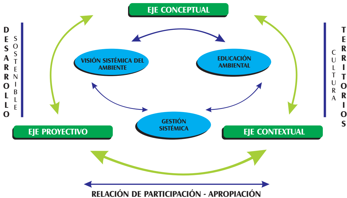
Figura No.1. Sistema Conceptual del Plan Municipal de Educación Ambiental

Contextualmente esta debilidad de la concepción de ambiente, educación ambiental, de “formación integral”, se ve reflejada en una baja cultura ambiental que sigue generando una grave crisis ambiental y que permite reconocer a la educación como la estrategia fundamental de cambio, de discurso crítico de la cultura y de la educación convencional.