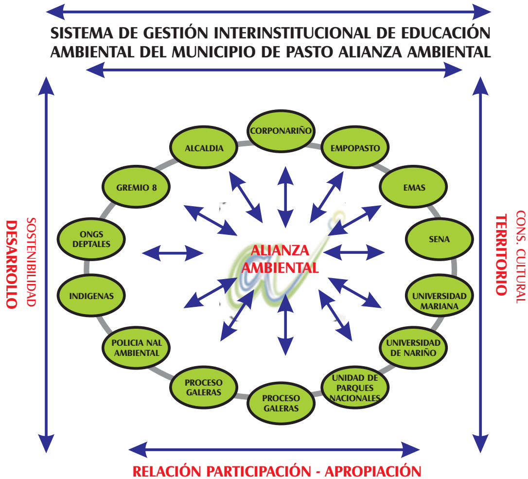
Figura No. 3. Instituciones Alianza Ambiental