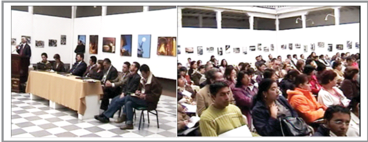
SGA Imagen No 8. Seminario de Construcción de Políticas Publicas

C) Taller Planeación Prospectiva y Estratégica: Taller que tuvo como objetivo formar, motivar y comprometer a los gestores de la educación ambiental, en la metodología de Planeación Prospectiva y Estratégica de Sostenibilidad Regional, para que asuman el rol de dinamizadores de la construcción del plan decenal de educación ambiental municipal de Pasto, e interactuar con los actores estratégicos. La metodología para la formulación de los programas y proyectos del Plan Decenal de Educación Ambiental del Municipio de Pasto es la planeación prospectiva y estratégica, la cual es una propuesta donde se plantean alternativas a la planificación e identifican las posibilidades de la región y las características que debe tener el territorio cuando haya alcanzado condiciones integrales de sostenibilidad, sin limitarse a la identificación diagnóstica de necesidades y problemas, en este caso se identifica como se va a estructurar la educación ambiental en el municipio de Pasto y que actividades se deben realizar para llegar un plan de educación ambiental oportuno para la región, y concertado con la comunidad e instituciones competentes en lo educativo-ambiental (Alianza ambiental y REDPRAE).