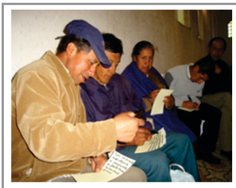
SGA. Imagen No 14. Aportes de la Comunidad

En esta etapa ha permitido consolidar los marcos contextuales, conceptuales y proyectivos de la política de educación ambiental y relacionarla (situarla y comprenderla) con el Municipio. Los espacios generados en esta etapa permitieron establecer un concienzudo análisis con respecto a la gestión sistémica de desarrollo, las acciones evocadas anteriormente fueron generadas para la desatomización de las diversas iniciativas que permitieron la concreción de una ruta de gestión más clara.