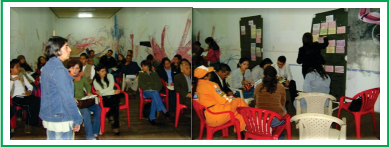
SGA. Imagen No 15. Mesas Participativas