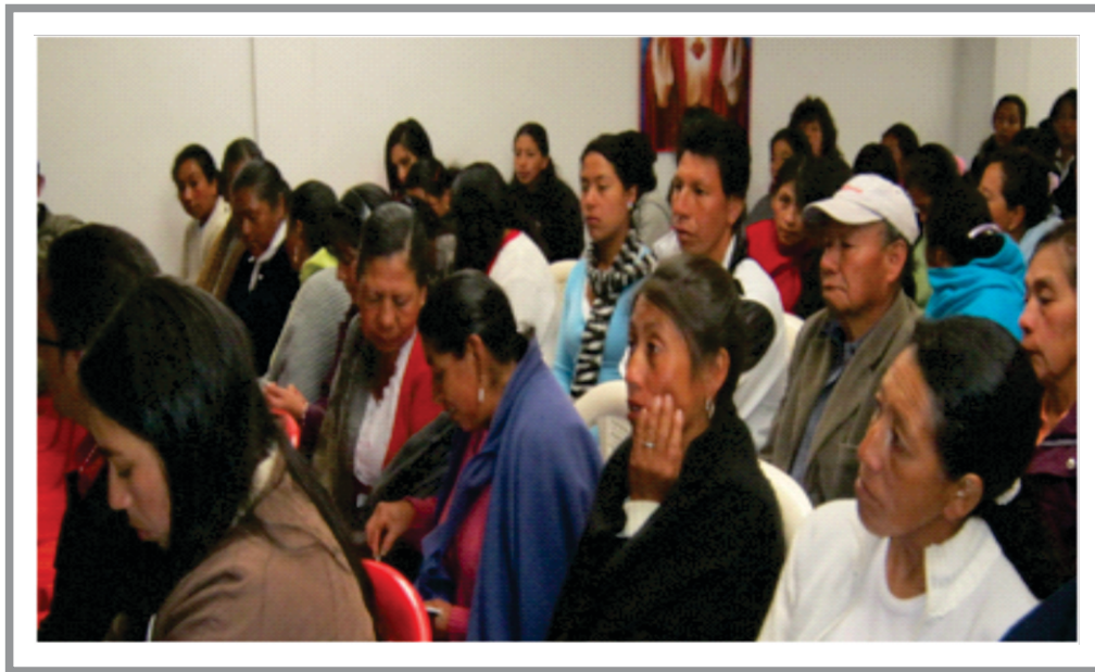
SGA Imagen No 4. Comunidad de Cabrera

Interpretando dicho sentido, la Administración Municipal desde el inicio de su gestión, adopta la participación como fuente de conocimiento, de organización y de producción, mediante la cual se logran transformaciones de impacto, debido a que ella trae consigo el compromiso de cada ciudadano para alcanzar metas comunes.