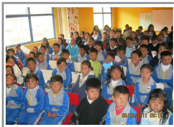
SGA Imagen. Sensibilización ambiental en el sector rural (Jurado)