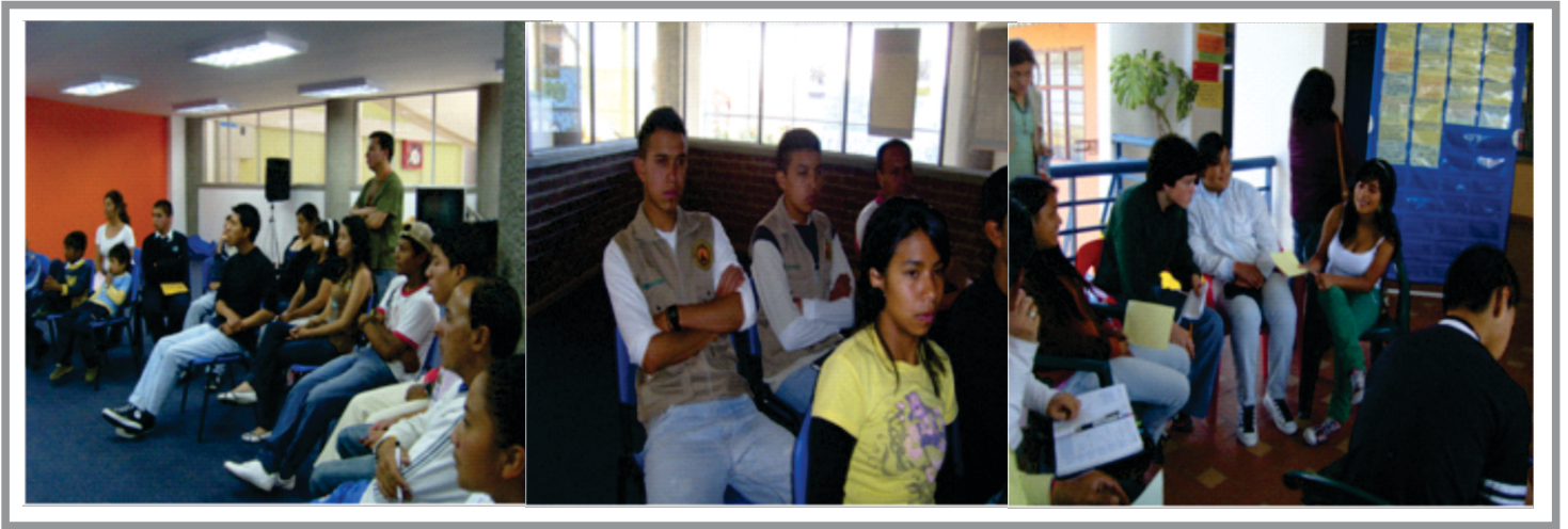
SGA. Imagen No 13. Taller con Jóvenes visión del Plan Decenal de Educación Ambiental

F) Mesas temáticas: se realizó un taller piloto con los estudiantes del programa de geografía aplicada y licenciatura en sociales de la Universidad de Nariño, con el propósito de socializar y retroalimentar el proceso participativo de construcción de los planes decenales de educación ambiental haciendo énfasis en Proyectos Ambientales Universitarios y concertar los lineamientos conceptuales que debe regir el Plan Decenal de Educación Ambiental; así mismo se realizó un encuentro con los gerentes PRAE y REDPRAE con el fin de analizar y concertar el desarrollo y proyección de los Proyectos Ambientales Escolares.