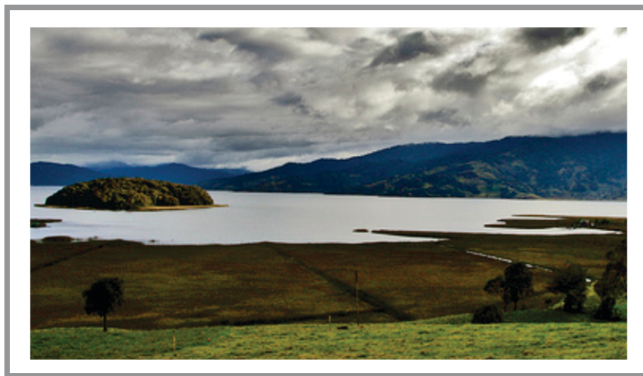
SGA Imagen No 1 Laguna de La Cocha

Los actores sociales, presentan diferentes niveles de aprehensión conceptual; lo que se traduce en que el concepto de ambiente, por parte de las instituciones del sector educativo ambiental, sigue siendo naturalista y con tendencia ecológica, por concebir el ambiente a nivel de slogan, “es el entorno que nos rodea”, es “todo lo que nos rodea”, no se involucra un análisis de las interacciones de las dimensiones natural, social y cultural propia de la visión y enfoque sistémico del ambiente, situación que deja ver el desconocimiento de competencias y responsabilidades, el desmedido protagonismo, la inestabilidad y variabilidad de actores dando como resultado un trabajo descoordinado, atomizado.