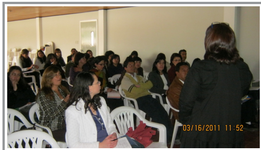
SGA Imagen. Taller REDPRAE Municipio de Pasto