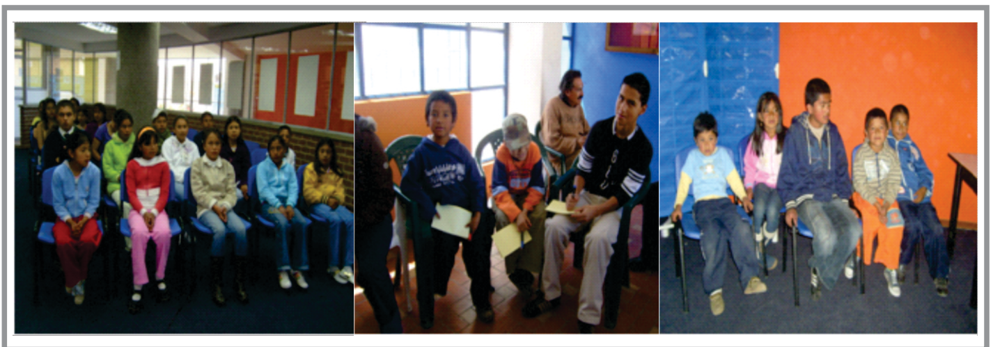
SGA. Imagen No 12. Taller con niños visión del Plan Decenal de Educación Ambiental