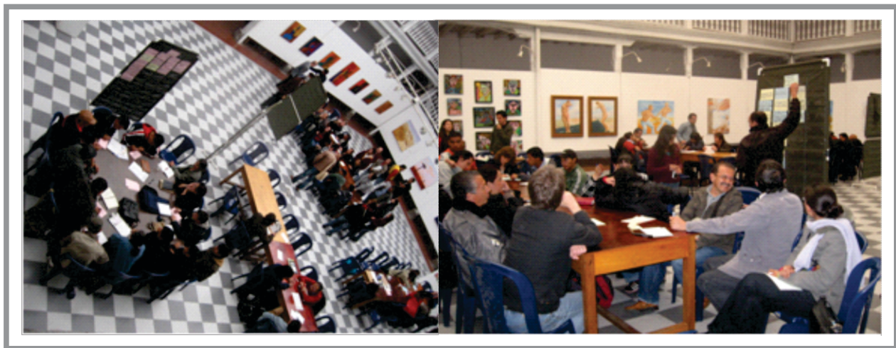
SGA Imagen No. 9. Taller planeación prospectiva y estratégica

C) Taller Planeación Prospectiva y Estratégica: Taller que tuvo como objetivo formar, motivar y comprometer a los gestores de la educación ambiental, en la metodología de Planeación Prospectiva y Estratégica de Sostenibilidad Regional, para que asuman el rol de dinamizadores de la construcción del plan decenal de educación ambiental municipal de Pasto, e interactuar con los actores estratégicos. La metodología para la formulación de los programas y proyectos del Plan Decenal de Educación Ambiental del Municipio de Pasto es la planeación prospectiva y estratégica, la cual es una propuesta donde se plantean alternativas a la planificación e identifican las posibilidades de la región y las características que debe tener el territorio cuando haya alcanzado condiciones integrales de sostenibilidad, sin limitarse a la identificación diagnóstica de necesidades y problemas, en este caso se identifica como se va a estructurar la educación ambiental en el municipio de Pasto y que actividades se deben realizar para llegar un plan de educación ambiental oportuno para la región, y concertado con la comunidad e instituciones competentes en lo educativo-ambiental (Alianza ambiental y REDPRAE).