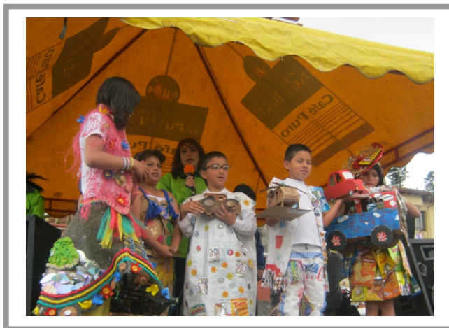
SGA Imagen. Festiparque Ambiental 2011

B) Seminario Regional de Construcción de Políticas Públicas en Torno a la Cultura y Educación Ambiental: El cual tuvo como objetivo conocer, reflexionar y consensuar diferentes conceptos, nociones y experiencias en torno a la cultura y la educación ambiental, donde se trataron temas tales como: gestión cultural y destino, cultura carnaval y región, cultura ciudadana y medio ambiente, cultura, región y globalización, cultura ambiental, incorporación de la dimensión ambiental en la escuela, cultura comunicación y estrategias, cultura y región, cultura y educación ambiental, políticas públicas y región, políticas públicas en gestión ambiental, política nacional de educación ambiental, entre otras. (Octubre 2008).