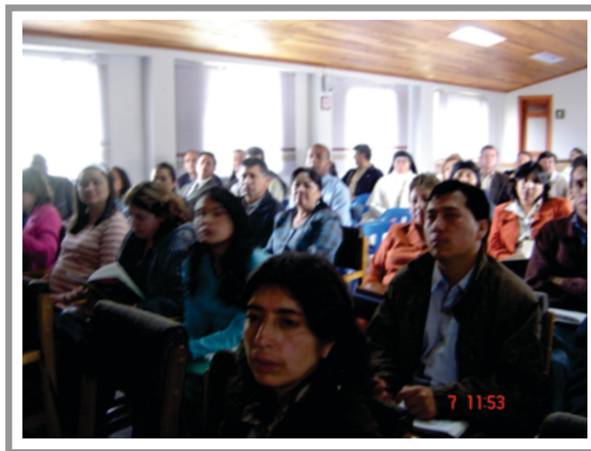
SGA Imagen No. 16 Taller Docentes Gerentes PRAE

Retos Y Actores: La educación ambiental como proceso pedagógico integrador, debe ofrecer continuidad en la generación de optimas estrategias, para la promoción del uso adecuado de los residuos sólidos, la conservación de zonas verdes, la atención de los diversos espacios ambientales entre otras acciones, teniendo en cuenta que la educación ambiental comienza desde el hogar y es producto de una búsqueda continua de identidad ambiental por parte de todos los actores involucrados en estas acciones.