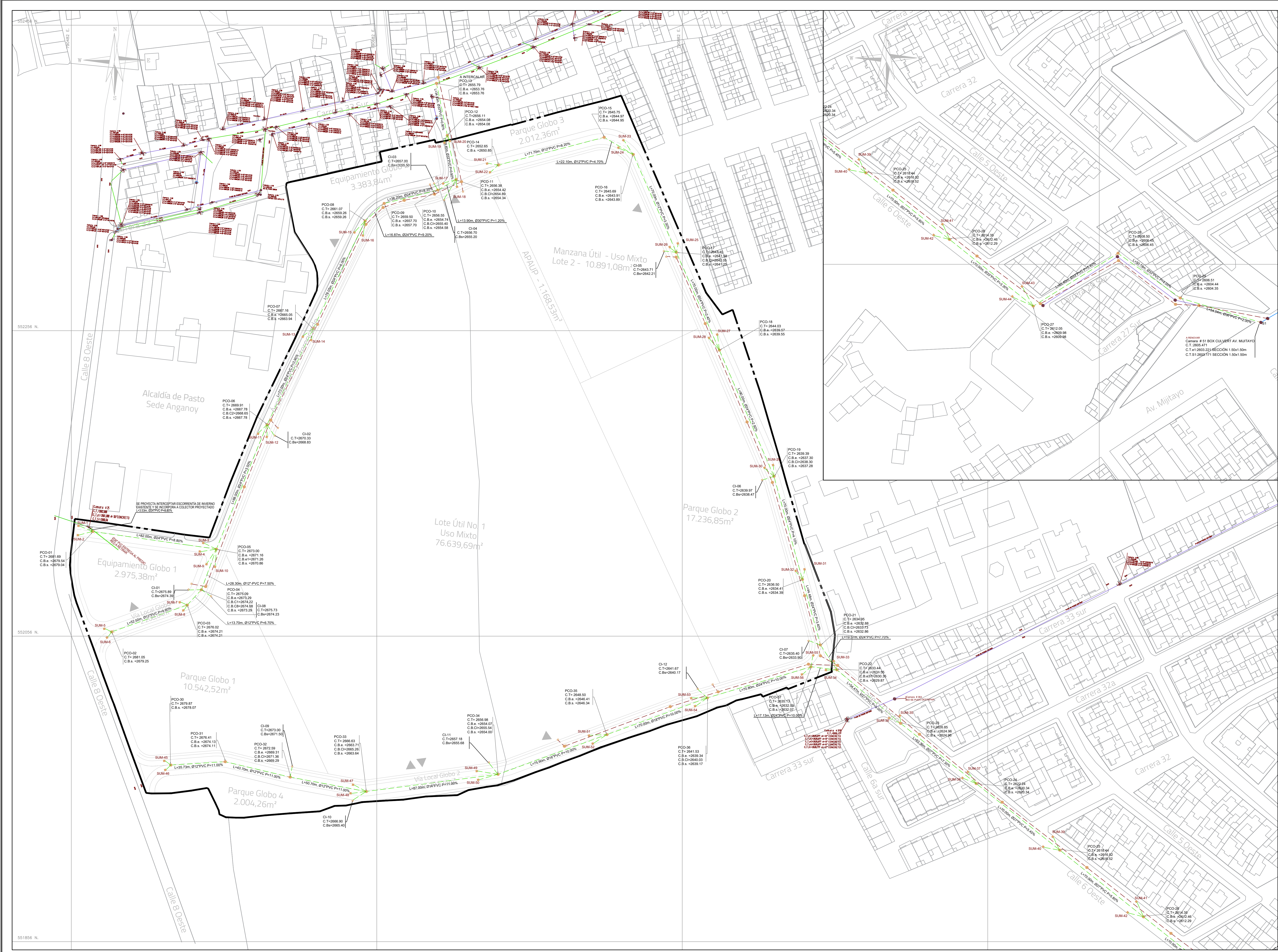
PLANTA GENERAL ESCALA 1:1000